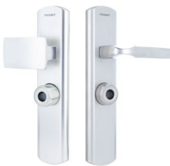
Aileron sur plaque