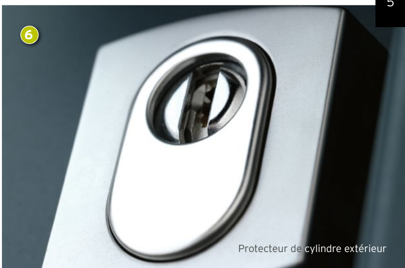
Protecteur de cylindre extérieur