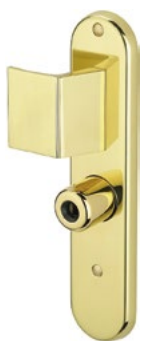
Béquille / Aileron / Bouton sur plaque