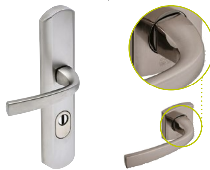
Béquille sur plaque extérieure