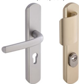
Béquille sur plaque