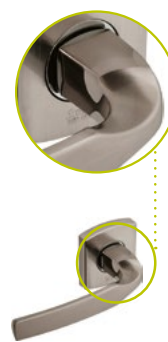
Béquille sur rosace