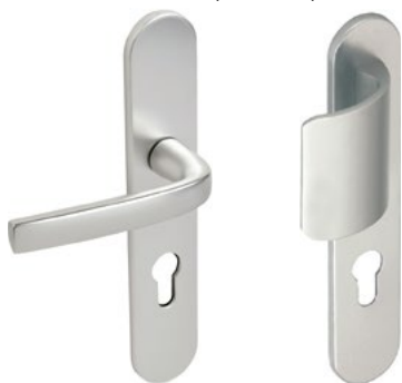
Béquille sur plaque