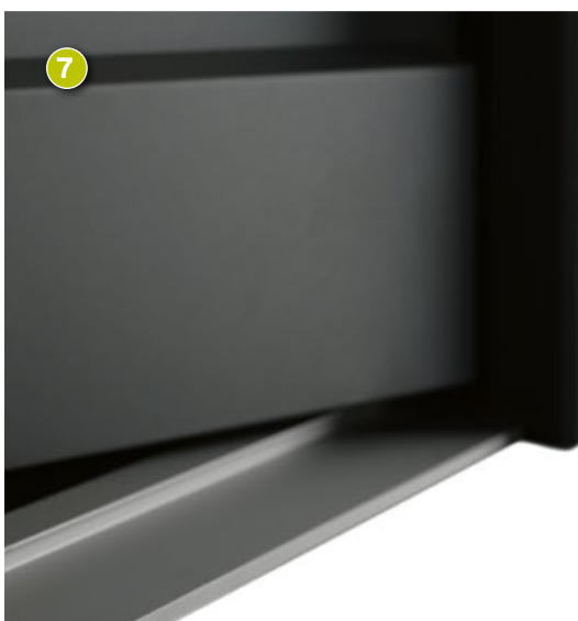
Barre de seuil et rejet d'eau